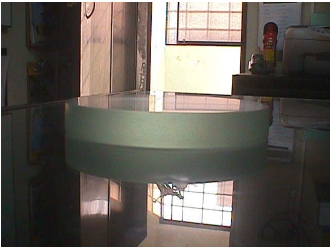
Aspecto al término del esmerilado